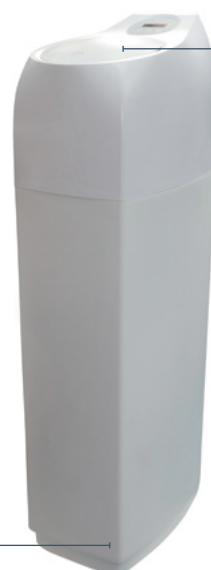
EVOLIO 5800 SXT