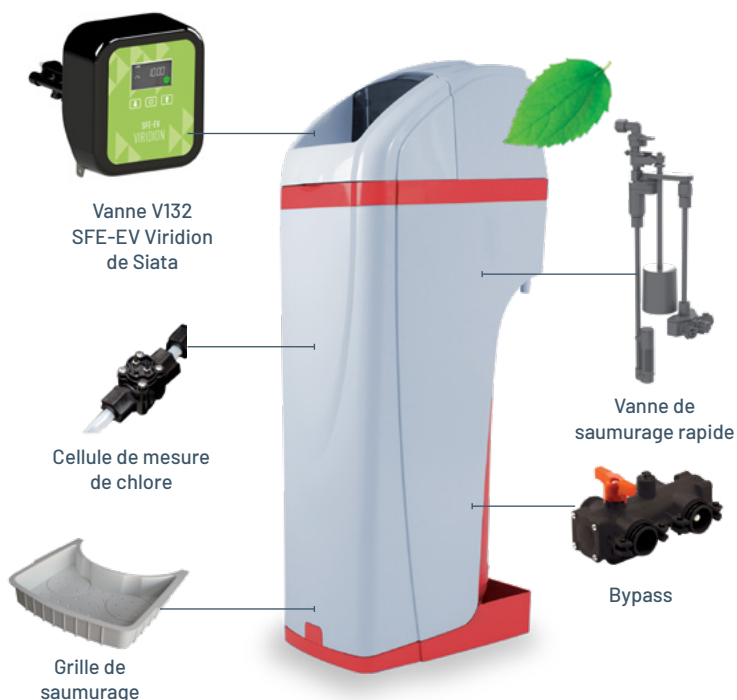
Vanne V132 SFE-EV Viridion de Siata