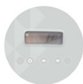
Affichage électronique intégré