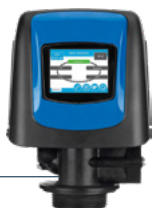
Vanne Fleck 5800 XTR