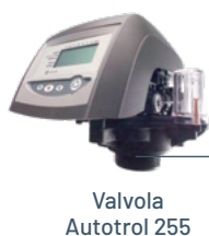
Valvola Autotrol 255