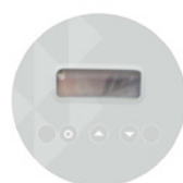
Display elettronico integrato