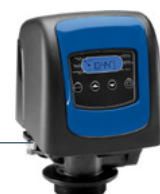
Valvola Fleck 5800 SXT