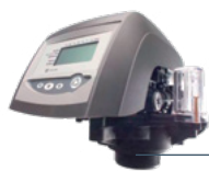
Głowice 255 Autotrol