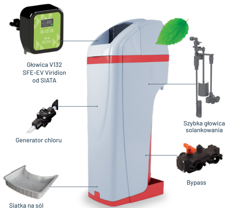
Głowica V132 SFE-EV Viridion od SIATA