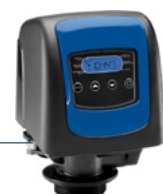
Głowice 5800 SXT Fleck