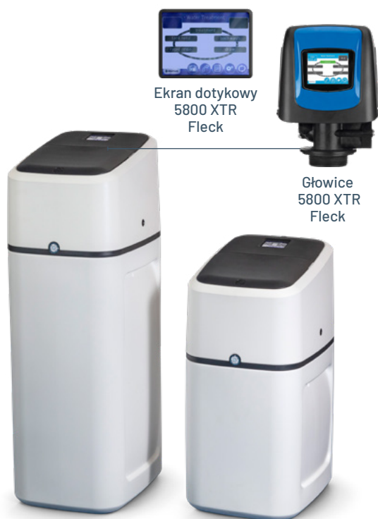
Ekran dotykowy 5800 XTR Fleck