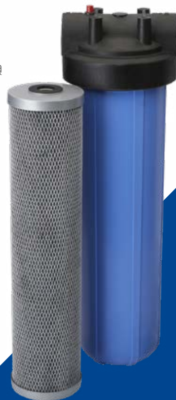
Filtracja PFOA/PFOS FloPlus Protect 20BB