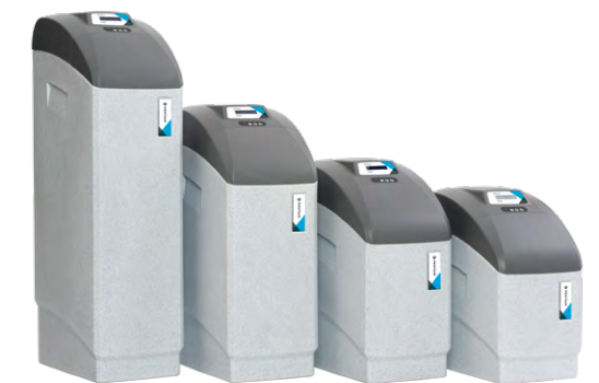
Het IQ Soft-gamma

Pentair, dat al sinds jaren kleppen voor de sector van de waterbehandeling verdeelt, biedt sinds 2011 een nieuwe reeks van plug-and-play-waterontharders aan. Ontdek hier ons gamma van onthardingssystemen die zijn ontwikkeld voor huishoudelijke en licht commerciële toepassingen.