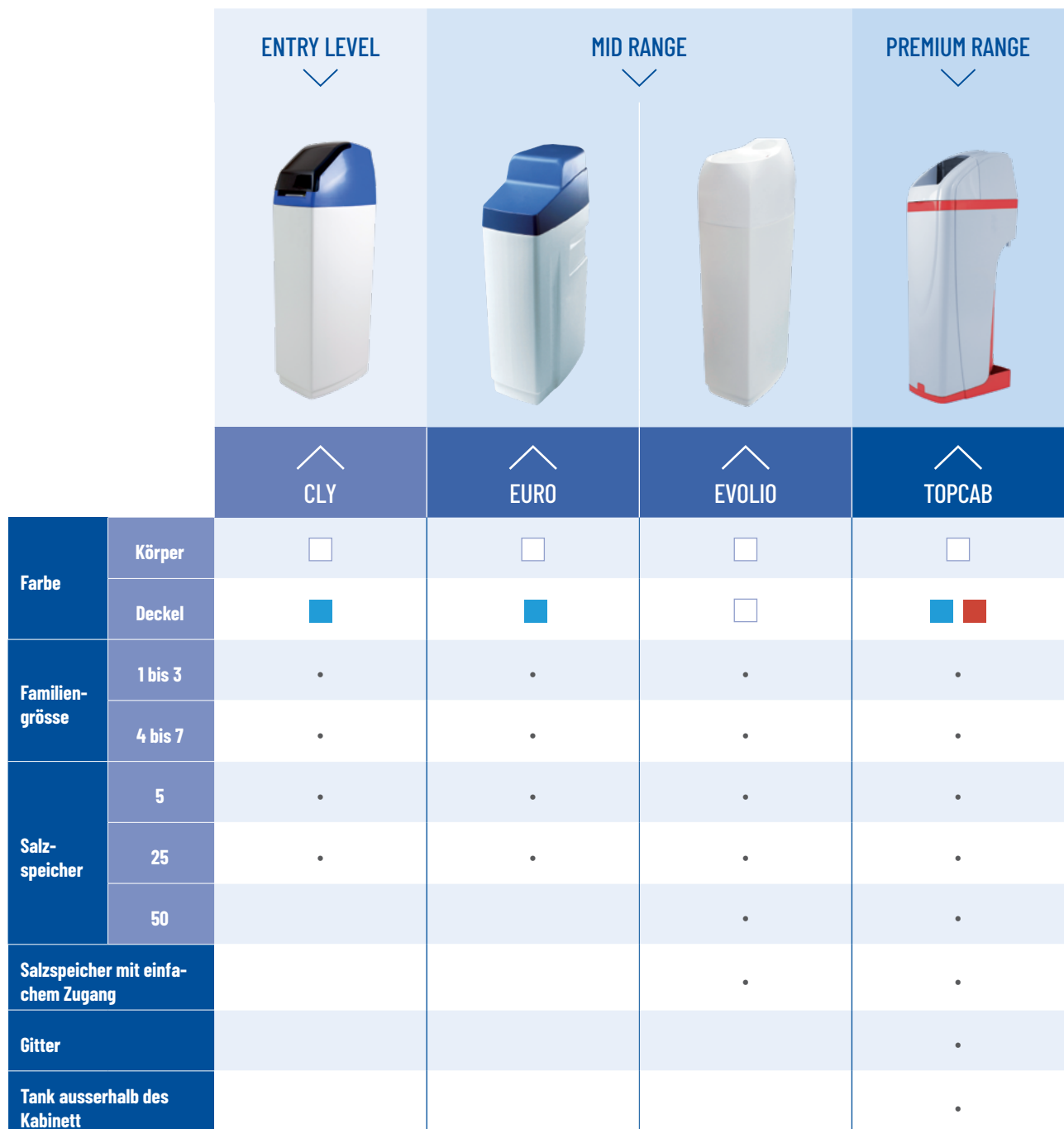
Sortiment an Kabinett-Paketen

Dieses überarbeitete Angebot an Kabinett-Paketen ist nun besser mit unserem Sortiment an verpackten Produkten (= Anlagen) vereinbar. Kunden können nun Kabinett-Pakete wie die Modelle Cly zum Einstiegspreis oder Kabinett-Modelle im mittleren Preissegment wie das Euro und das neue Evolio erwerben. Das Angebot wird mit dem TopCab in seinem neuen Look mit rotem Band abgerundet.